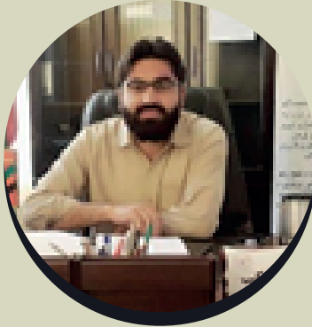
پوهنمل دوکتور احمد جاوید شکیب