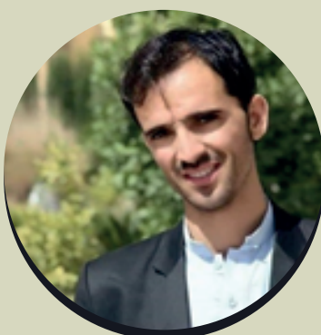
پوهنمل هلال ارشاد